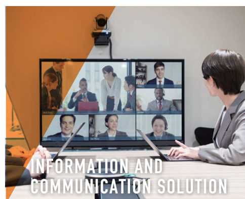
INFORMATION AND COMMUNICATION SOLUTION